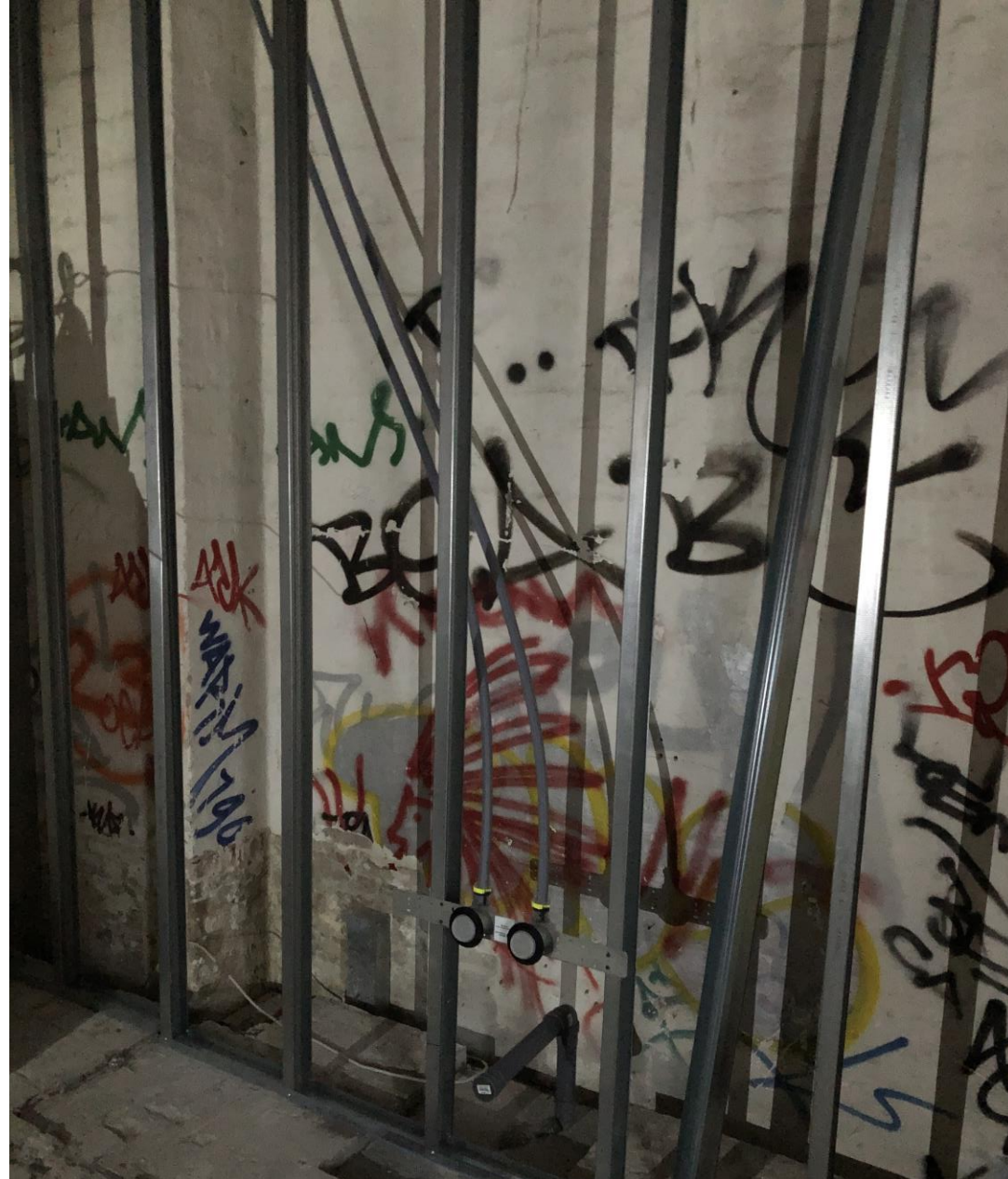
Et vidnesbyrd fra den gang bygningen stod tom efter lukningen af Nordisk Fjer.